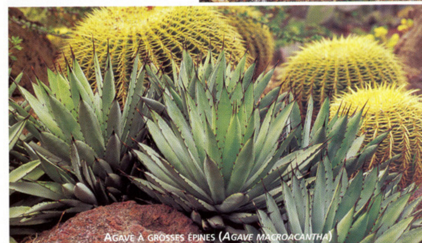
AGAVE À GROSSES ÉPINES ( AGAVE MACROACANTHA )