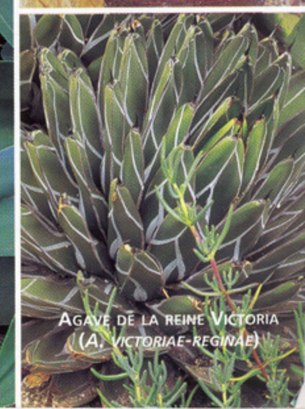
AGAVE DE LA REINE VICTORIA ( A. VICTORIAE-REGINAE )