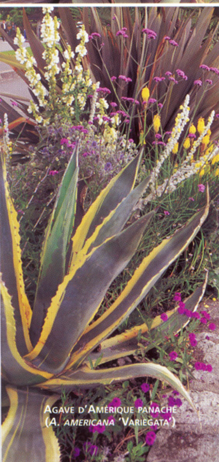
AGAVE D'AMÉRIQUE PANACHÉ ( A. AMERICANA 'VARIEGATA')

Les agaves et les aloès sont des plantes bien connues. Les premiers, qui abondent dans les déserts nord-américains, sont utilisés dans la fabrication de la tequila. Bien que certaines espèces fleurissent en un candélabre gigantesque, la majorité sont prisées pour leur magnifique rosette de feuilles charnues et épaisses, souvent colorées, à coup sûr stylisées. Quant à l'aloès, il est célèbre grâce aux propriétés médicinales de l'un d'eux, l' Aloe vera . Néanmoins, avec plus de 325 espèces essaimées sur le continent africain, l'aloès prend mille et un visages. De cette plénitude, le jardinier peut choisir ses préférés et les utiliser en pot ou à même les massifs floraux en manque d'une touche exotique. Et le plus extraordinaire, c'est que les soins à leur prodiguer sont presque nuls !