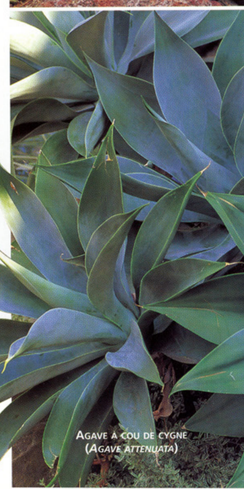
AGAVE À COU DE CYGNE ( AGAVE ATTENUATA )