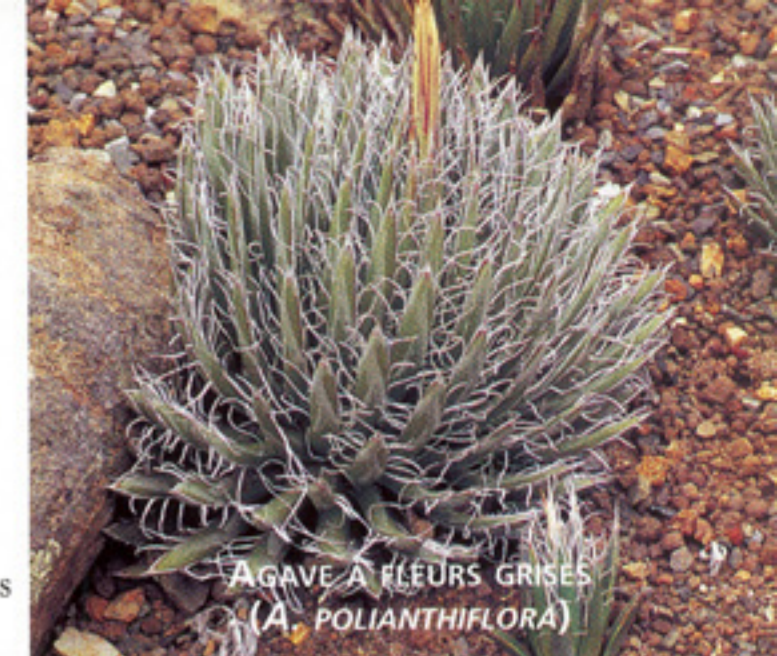
AGAVE À FLEURS GRISSES ( A. POLIANTHIFLORA )

fleurs grises ( A. polianthiflora ) est le nain du trio. On pourrait avantageusement associer le plus grand de ces agaves panachés avec la verveine de Buenos Aires ( Verbena bonariensis ) et des molènes de choix ( Verbascum chaixii ) ; les plus petits auraient fière allure avec l'avoine bleue ( Helictotrichon sempervirens ) et les petits zinnias blancs ( Zinnia 'Profusion White').